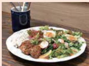
こくベジプレート