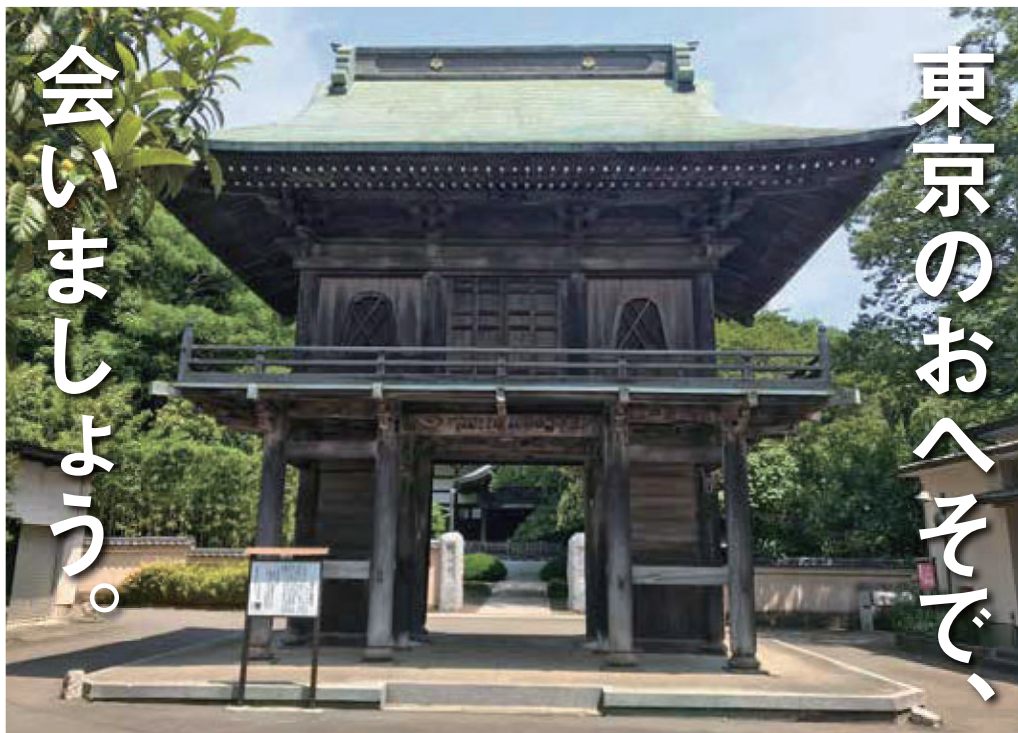
国分寺楼門（市重要有形文化財） [拡大図 map c-2]