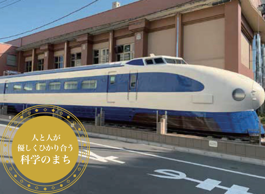
新幹線試験電車951形(昭和44年製造)

新幹線をはじめとする鉄道の研究開発の地。 人の思いを乗せ、未来へ夢をつなぎます。